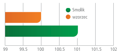
Wyniki PDOiR w rejonie północnym 2011